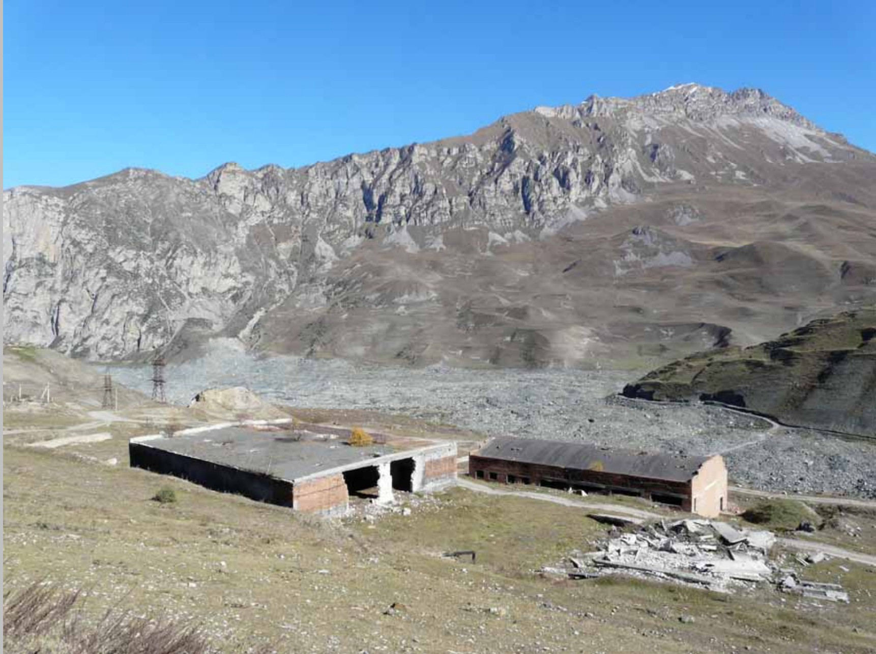
Последствия селя в МО Кармадон, вовлеченном в реализацию проектов Консорциума