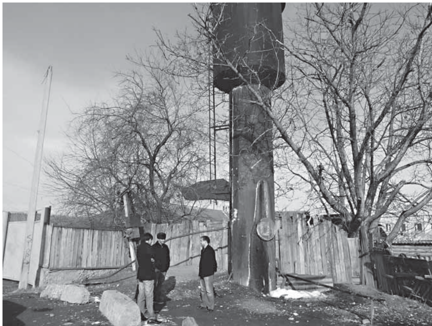
Реконструкция водонапорной башни и трансформатора в с. Белгатой позволит обеспечить водой районную больницу и жителей села

устаревшего трансформатора, что даст ощутимую экономию электроэнергии и повышение качества питьевой воды в Белгатое и районной больнице.