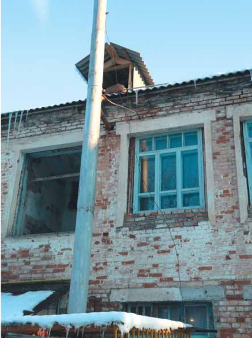
Состояние окон в школе-интернате № 1 Заводского района города Грозного до начала проекта

бойное снабжение водой, что позволит наконец обеспечить противопожарную безопасность в