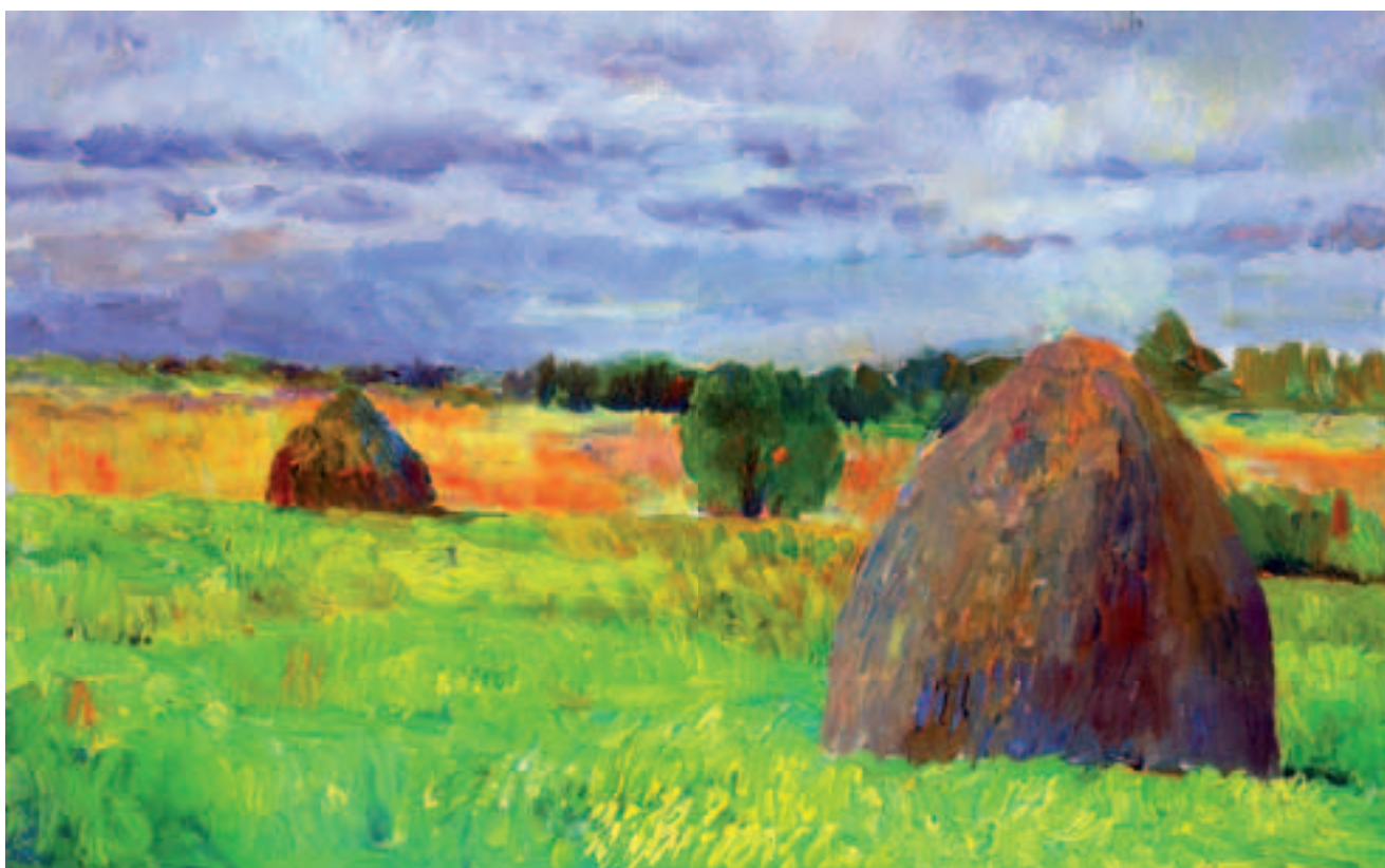
О. Теплуцкий. Лето кончается. 2009 г.