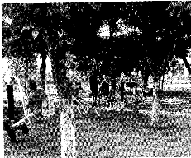
Тренажеры не знают отдыха.